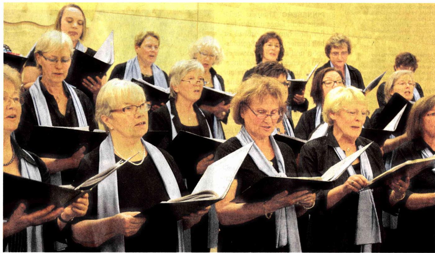
Zur Zeit gehören dem stimmgewaltigen Ensemble des Frauenchors Pinneberg 56 Damen an.